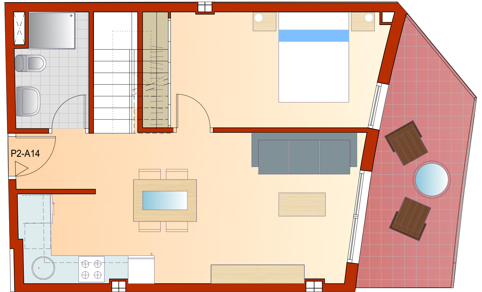
PLANTA SEGUNDA e=1/50